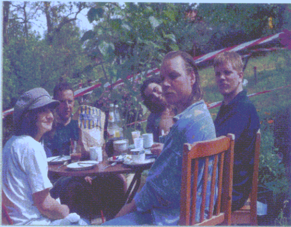
Pause beim „Gartenprojekt“