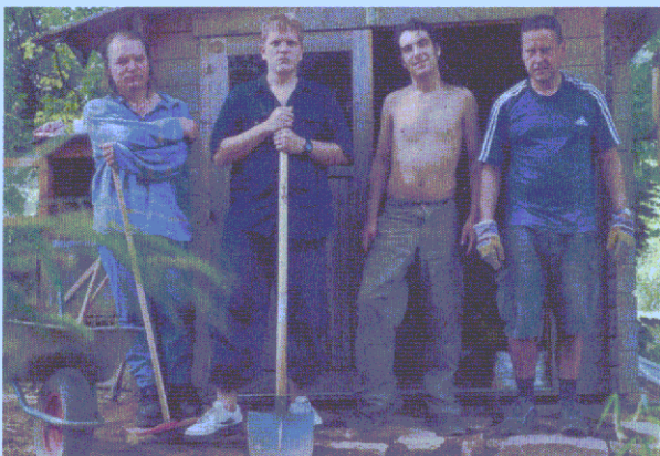
Einsatz im „Gartenprojekt“

Unsere Karlsruher AWO-Ambulanz beteiligt sich seit über einem Jahr am Modellprojekt zur heroingestützten Behandlung Opiatabhängiger. Bundesweit werden über 1100 Schwerstabhängige in diesem Modellprojekt behandelt. Heroingestützte Behandlung beinhaltet neben der Originalstoffabgabe und der Drogenberatung strukturierte Gruppenpsychotherapie sowie die internistisch/hausärztliche und psychiatrische Behandlung unserer Patienten.