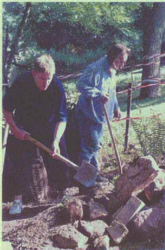
Bau einer Sandsteinmauer...